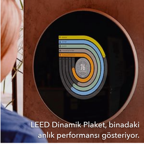
LEED Dinamik Plaket, binadaki anlık performansı gösteriyor.

LEED Sertifikalı binalarda çalışanlar %93 daha mutlu olduklarını, %85'i daha kaliteli ortamda çalıştıklarını %80'i iç hava kalitesini beğendiğini söylemektedir.